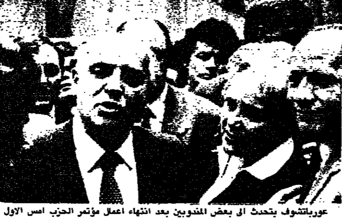
عورباتشوف يبحث الى بعض المتوطين بعد انتهاء أعمال مؤتمر الحزب اسد الاول

بحث الوحدة الامنية مع شيفاردنارزه وغورباتشوف في بحث الوحدة الامنية مع شيفاردنارزه وغورباتشوف